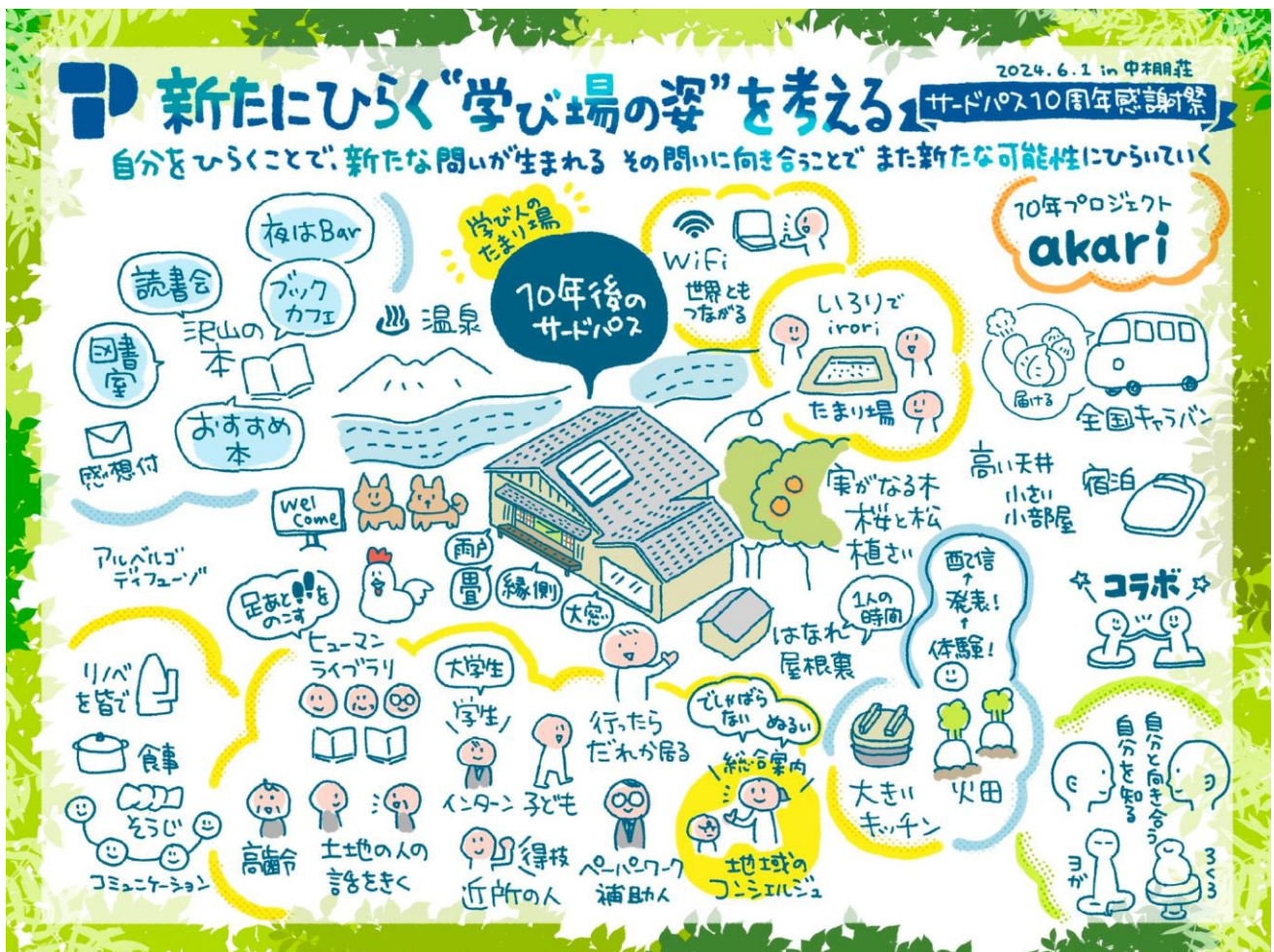
【図】当日のグラフィックレコーディング