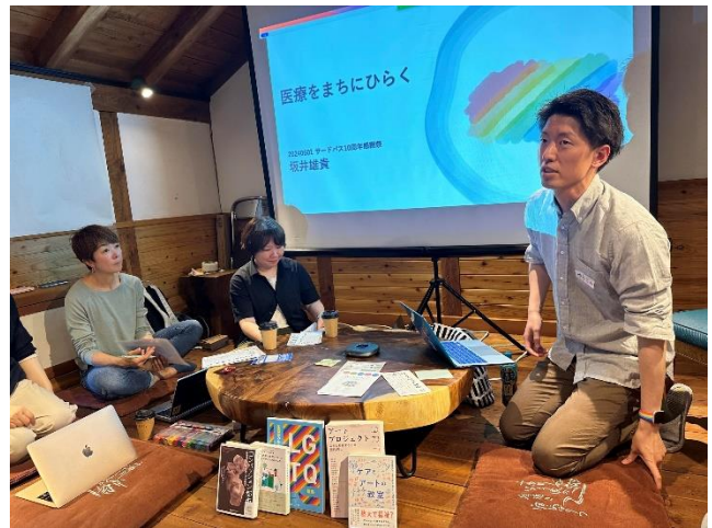
【写真】10周年感謝祭の様子