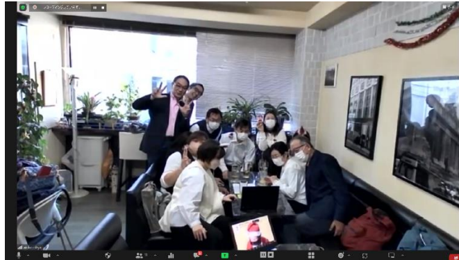
【写真】クリスマスの集いハイブリッド開催の様子